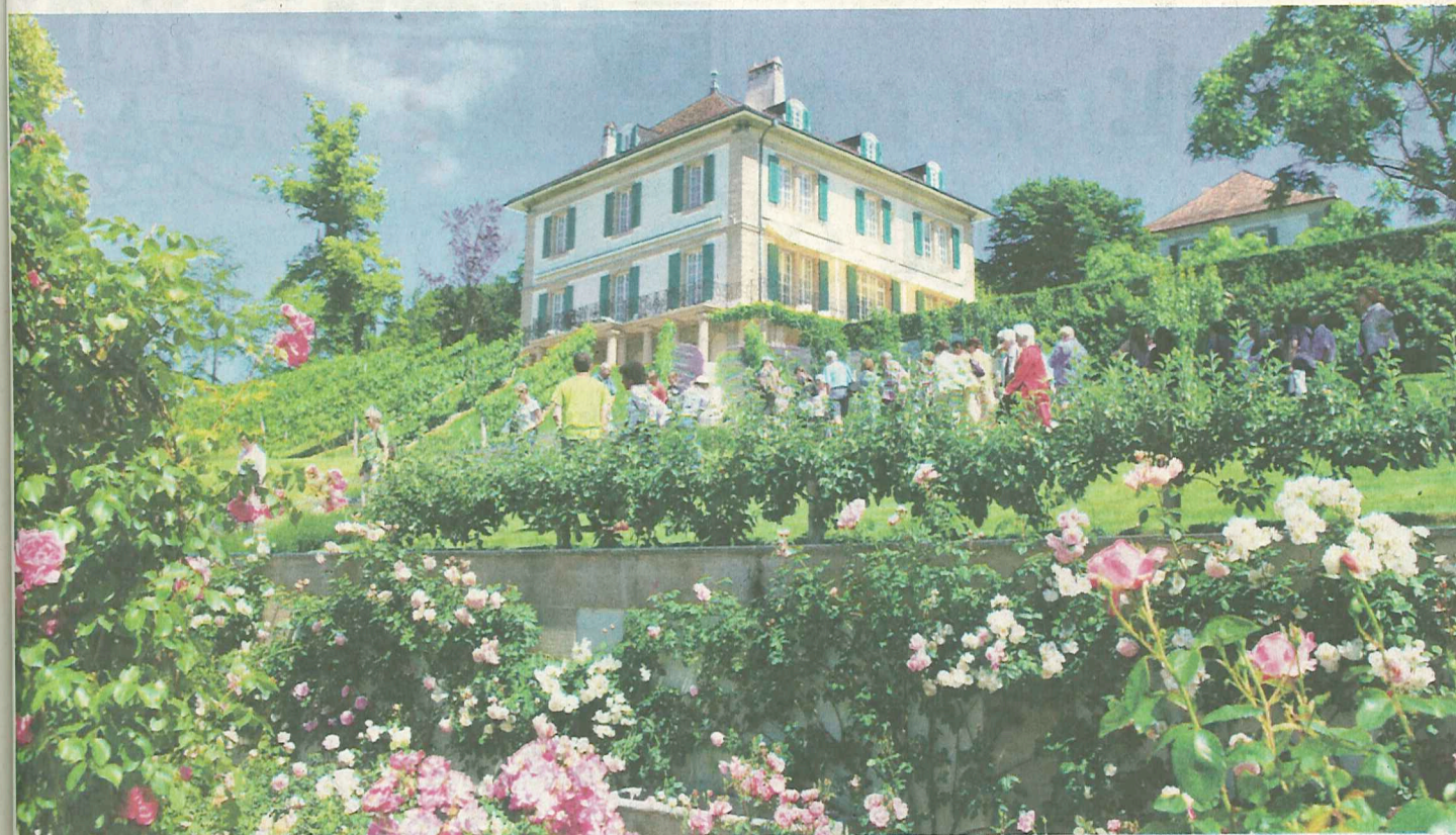
On doit au Centre social protestant et à la générosité des propriétaires la découverte d'un domaine d'exception. PATRICK GILLIERON-LOPRENO