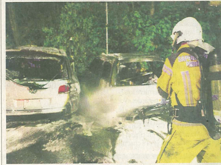
Les deux voitures sont totalement détruites.

Voir nos photos sur: www.tdg.ch/alhambra